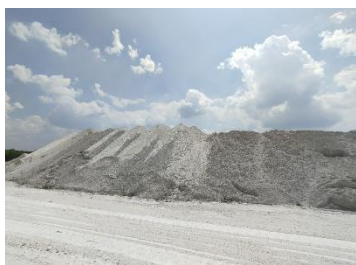
ลานเก็บกองแร่