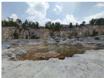
พื้นที่หน้าเหมือง