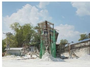
โรงแต่งแร่ของโครงการ