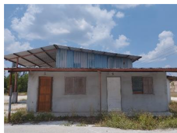
บ้านพักพนักงาน