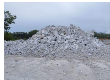
กองเปลือกหิน/ดิน