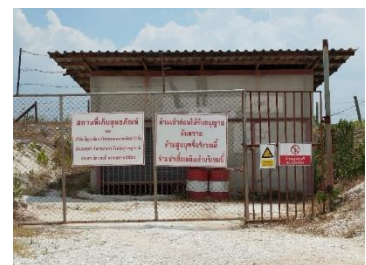
อาคารเก็บวัตถุระเบิด